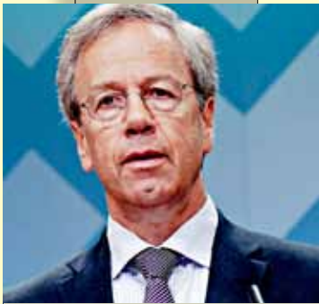
ØYSTEIN OLSEN: Sentralbanksjefen senket kronkursen med ny rentebane. Eksportørene jubler.