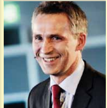
JENS STOLTENBERG : 20 prosentpoeng bak Erna & Co når ferien starter. Kan Jens slå Lasarus?