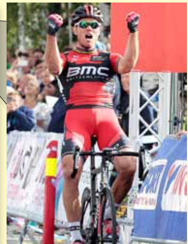
THOR HUSHOVD: Nektet start i Tour de France. Karrieren over.

– Nei, jeg kjøpte den da den kom, men datteren min ville lese den først og bruke den i et skoleprosjekt. Jeg får den vel om en uke, sier hun.